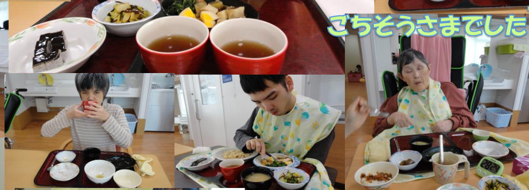
ごちそうさまでした