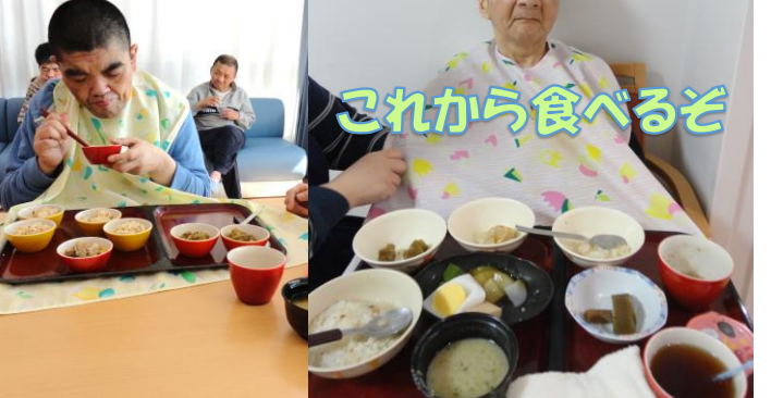
これから食べるぞ