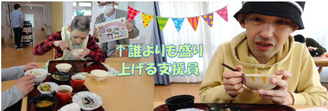
↑誰よりも盛り上げる支援員